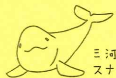
三河湾の スナメリ